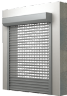
BKR / SK