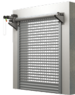
BKR / KNS