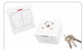
Przetaczniki klawiszowe i kluczykowe