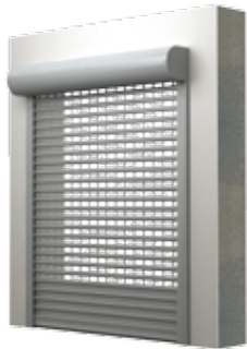
BKR / SKO-P