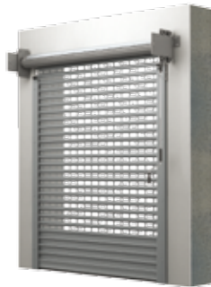
BKR / KNB